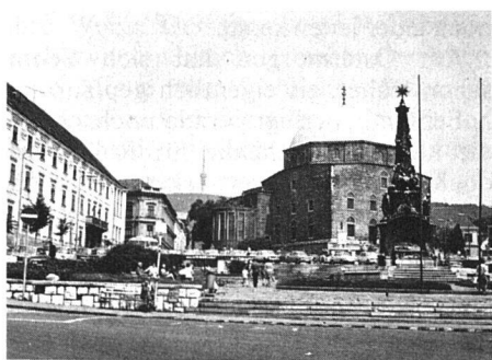
Pécs, im Zentrum, am Széchenyi-Platz