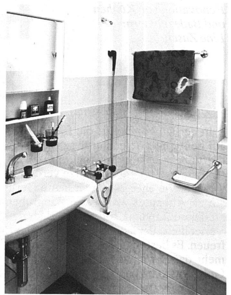
...und nach vollendeter Renovation

Bodenbeläge verlegt, die Wand- und Deckenpartien frisch gestrichen und über den Apparaten wurden die Wände mit Plattenbelägen versehen.