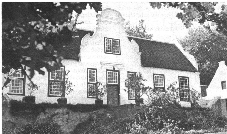
Unten: Haus im kapholländischen Stil

Interessant war der Besuch in einer Wohnsiedlung für Bantus. In einer sehr abgelegenen Gegend auf 2000m Höhe ist ein grosses Industriewerk in Betrieb. Das gesamte Personal musste von weiter geholt werden. Die Neger, deren Familien noch in ihren angestammten Dörfern leben, wohnen zu viert in sauberen Unterkünften, ähnlich wie viele unserer Gastarbeiter. Eine moderne Grossküche sorgt für die Verpflegung der schwarzen Hilfskräfte. Sie fassen in