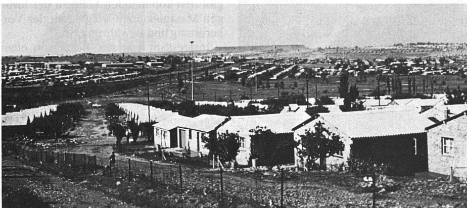
Unten: Kleine Teilaussicht auf Soweto.

Löhne dieser Leute, über ihren weiten Arbeitsweg, über ihren Wohnortszwang und über viele andere heikle Fragen der «grossen und der kleinen Apartheid». Neben ihr sass ein Polizeibeamter in Zivil, von dem wir nicht wussten, ob er die Beamtin, den Chauffeur oder uns überwachen oder schützen musste.