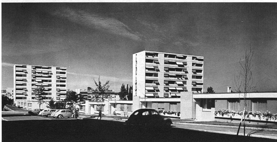
Abbildung links: Die viel bewunderten Atriumshäuser der Siedlung «Obermatten», dahinter die beiden Hochhäuser der Rotach und der ASIG. Oben: Gesamtansicht der Siedlung Obermatten in Rümlang.

Mit ihren 15 ein- bis achtgeschossigen, differenzierten Gebäulichkeiten erscheint heute die Siedlung «Obermatten», in helles Grün grosser Rasenflächen eingebettet, von der Sonne beschienen, als eine weite, sonntägliche Anlage, eine Heimstätte vieler Familien. Zusammen mit der nachbarlichen Siedlung der Baugenossenschaft Röntgenhof war die Siedlung «Obermatten» an der raschen Entwicklung der Gemeinde Rümlang mitbeteiligt.