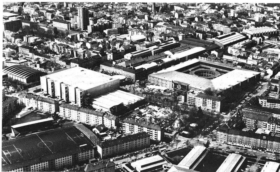
Das Messegelände der Swissbau

«Für mich ist dieses Zusammengehen kein Experiment, sondern eine selbstverständliche Notwendigkeit im schweizerischen Messewesen. Nicht nur zwischen Zürich und Basel, sondern unter allen Messestädten unseres Landes muss diese Bereitschaft und dieser Wille zu einer engen Zusammenarbeit bestehen, wenn wir die Chance unseres Landes im Zentrum der Wirklichkeit werdenden