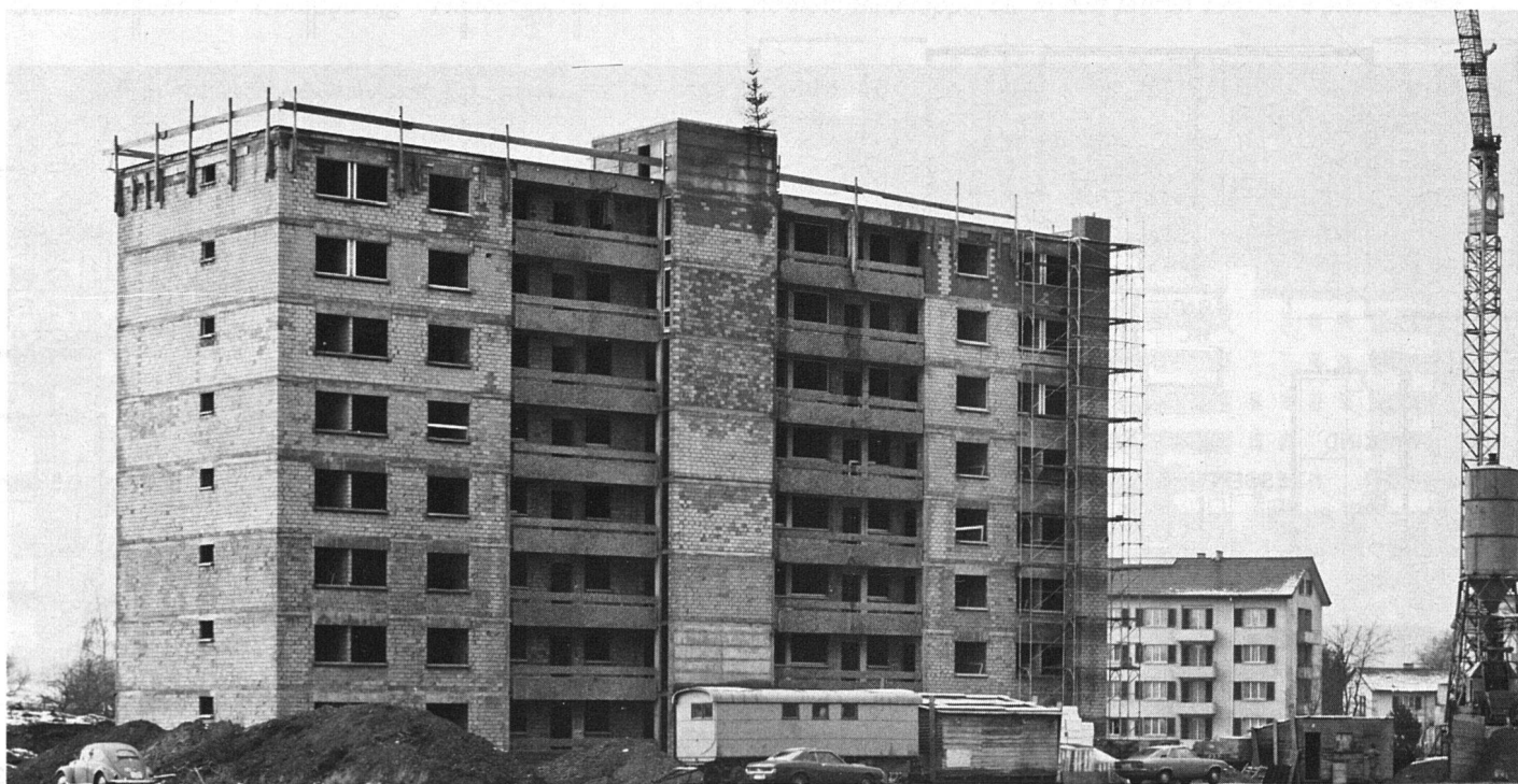
Überbauung «Schupfenzelg», 1. Etappe. Das 8stöckige Scheibenhochhaus.

Der Zeitpunkt für die Erstellung der zweiten und dritten Bauetappe hängt ganz von der Entwicklung der Wohnbevölkerung ab. Sollte aber die rege Nachfrage nach relativ günstigen Wohnungen