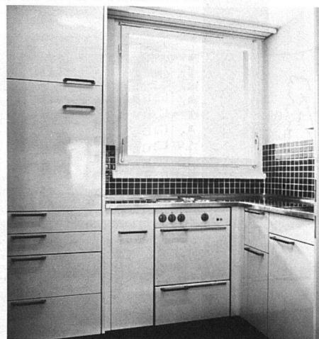
Blick in die modern ausgebaute Küche einer 3-Zimmer-Wohnung.

Wohnzimmer: Im Wohnzimmer wurde der bewährte Nadelfilzteppich verlegt. Dadurch wird die Arbeit der Hausfrau wesentlich erleichtert.