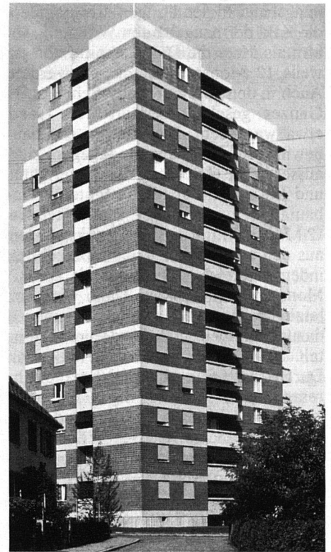
Oben: Hochhaus und Siedlungs-Dominante der Baugenossenschaft des Verkehrspersonals in Romanshorn.

Unsere Bilder zeigen einige Beispiele genossenschaftlicher Wohnhochhäuser – stellvertretend für zahlreiche weitere ästhetisch gut gelöste Siedlungen –, die uns als besonders gelungene Werke erscheinen. B.