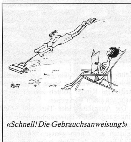
«Schnell! Die Gebrauchsanweisung!»

Um das Schnittgut aufzunehmen, gibt es heute leistungsfähige Rasenwischer. Sie arbeiten sehr rasch und sauber und