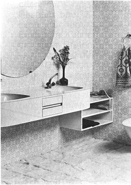
Zu unserer Foto links nebenstehend:

Unser Bild zeigt eine Waschtischkombination «Bijou», ausgestattet mit zusätzlichen Ablageflächen. Die Konstruktion ist flexibel; die auf der Zeichnung ersichtlichen Möbelemente können beliebig ausgewechselt oder ergänzt werden. Diese Art von Badezimmerausgestaltung ermöglicht es, einen grossen Raum zweckmässig auszunutzen und auch dem kleinen Badezimmer eine wohnliche Note zu verleihen.