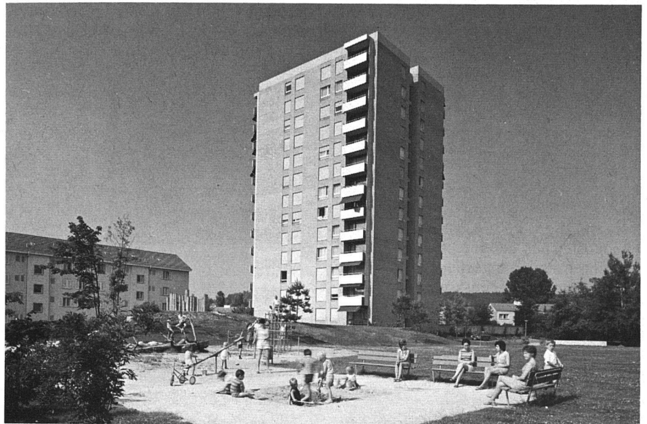
Hochhaus am Buck mit 52 Wohnungen auf 13 Stockwerken, Baujahr 1967. 3- und 4-Zimmer-Wohnungen, Mietzinse Fr. 315.- bis Fr. 475.-

In den hundert Jahren seit der Gründung der Gesellschaft änderte sich nichts an ihrer Aufgabe: den Wohnungsmangel zu mildern durch den Bau von Wohnungen, die zwar billig waren, die aber dennoch ein angenehmes, zeitgemässes Wohnen ermöglichten, wobei die Bauten sich einigermaßen ins Stadtbild einzufügen hatten.