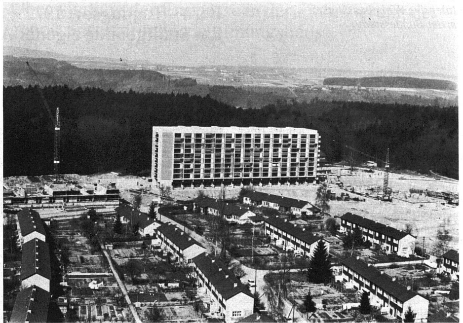
Überbauung Bethlehemacker Scheibenhäuser S1. Eigentümerin: Fambau Bern und Private. Rechts die Baustelle für das Hochhaus H2 der Fambau Bern (163 Wohnungen). Bezug der Wohnungen ab Februar 1973 – Mietzinszuschüsse von Bund, Kanton und Stadt Bern. Mietzins einer 4-Zimmer-Wohnung ab Fr. 650.– brutto.

Moderne Quartiere und neue Projekte wie Tscharnergut, Ausserholligen, Gäbelbach, Schwabgut, Bethlehemacker und Fellerhut, um einige Beispiele zu nennen, sind mit ein Ergebnis der Tätig-