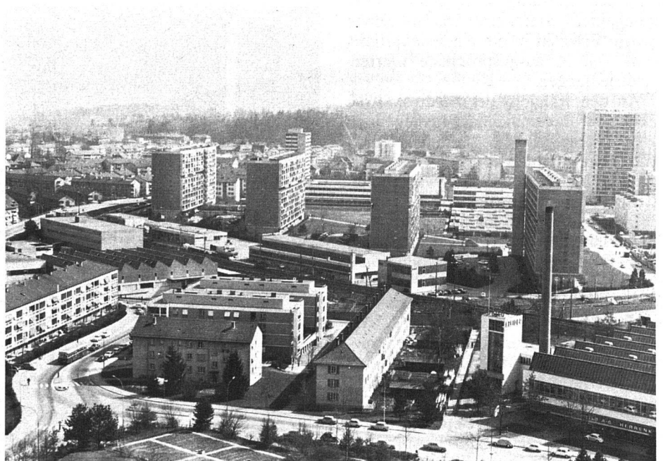
Ein Symbol des neuen Bern: Die Überbauung Schwabgut. Im Block links das Betagtenheim Schwabgut, eingefügt in die Gross-Überbauung.