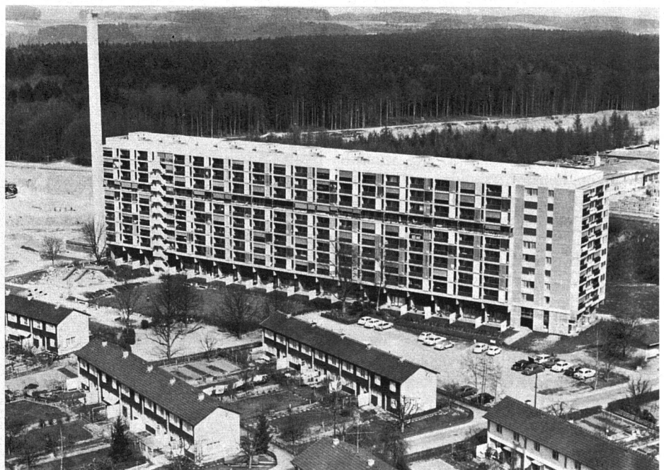
Überbauung Bethlehemacker, Scheibenhäuser S2. Eigentümerin: Siedlungsgenossenschaft der Holzarbeiter-Zimmerleute des SBHV und Private. Bezug 1969/70. Die Einfamilienhäuser vorn gehören der vorgenannten Baugenossenschaft und der Familienbaugenossenschaft Bern. Mietzinse im Scheibenhäuser: 4-Zimmer-Wohnungen brutto ab Fr. 530.– pro Monat.