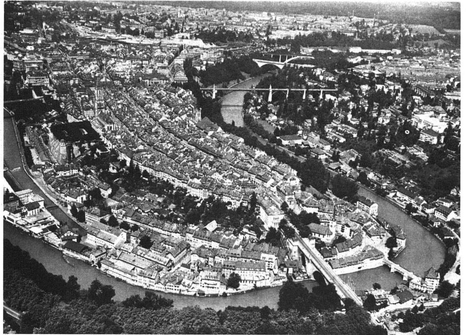
Das alte Bern, ein Meisterwerk mittelalterlichen Städtebaus, zugleich Mittelpunkt und Kernstück einer modernen, aufgeschlossenen Stadt.

Das Charakteristische dieser Strassen im Stadtkern ist, dass sie auf beiden Seiten von «Lauben» begleitet sind, Bogenhängen, die in die Häuserfassaden hinein gelegt sind, wie die portici der italienischen Kleinstädte. Die Strasse gehört dem Fahrverkehr; der Fussgänger durchwandelt die Lauben. Trockenen Fusses kann er, auch beim schlechtesten Wetter, die ganze Stadt durchqueren. «Läubeln» nennt es der Berner, wenn er, langsam und behaglich, diese luftigen