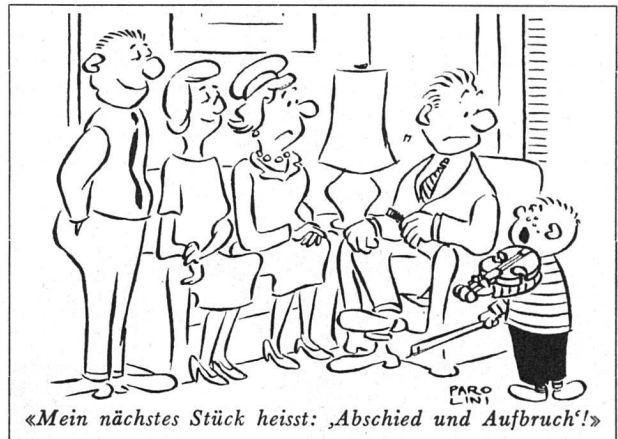
«Mein nächstes Stück heisst: „Abschied und Aufbruch“!»