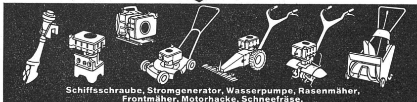
Schiffsschraube, Stromgenerator, Wasserpumpe, Rasenmäher, Frontmäher, Motorhacke, Schneefräse.