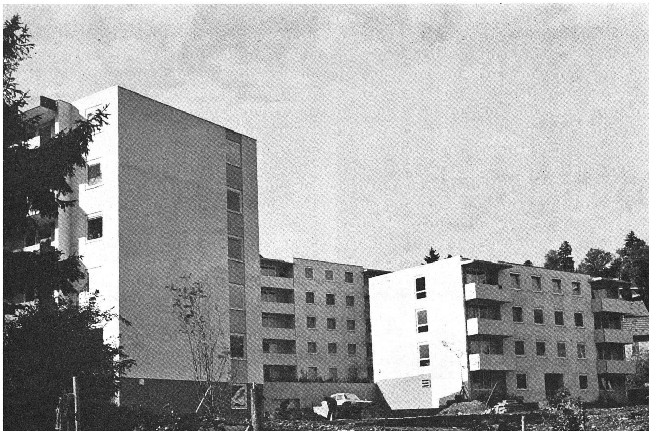
Die Überbauung «Riet» der Gemeinnützigen Wohnbaugenossenschaft Schaffhausen, die aus drei Wohnblöcken besteht.