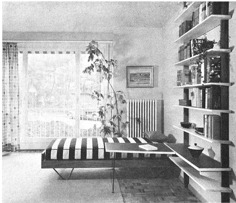
Vorhänge, Wände und Teppich in zurückhaltenden Farben, schlichte Möbel, dazu starkfarbig gestreifte Liegendecke schaffen eine entspannende Atmosphäre.

Immer mehr wird dem Kampf gegen den Lärm im Wohnbereich volle Aufmerksamkeit geschenkt. Auch die Wohn- und Baugenossenschaften sind am Ergebnis dieser Bemühungen interessiert. Von der optischen Unruhe beim Wohnen wird aber wenig gesprochen, obwohl diese in ähnlicher Weise schädlich sein kann wie die akustische Unruhe. Wenn diese Schäden auch selten bewusst empfunden werden, sind sie erfahrenen Ärzten durchaus bekannt. Die optische Ruhe im Raum trägt unbemerkt viel zum seelischen und körperlichen Wohlbefinden bei. Die geistigen Kräfte, die sich in diesem oder jenem Zimmer leichter entfalten und die auch zu besseren Arbeitsergebnissen führen, werden oft ganz unterbewusst aus der Ruhe im Raum gewonnen.