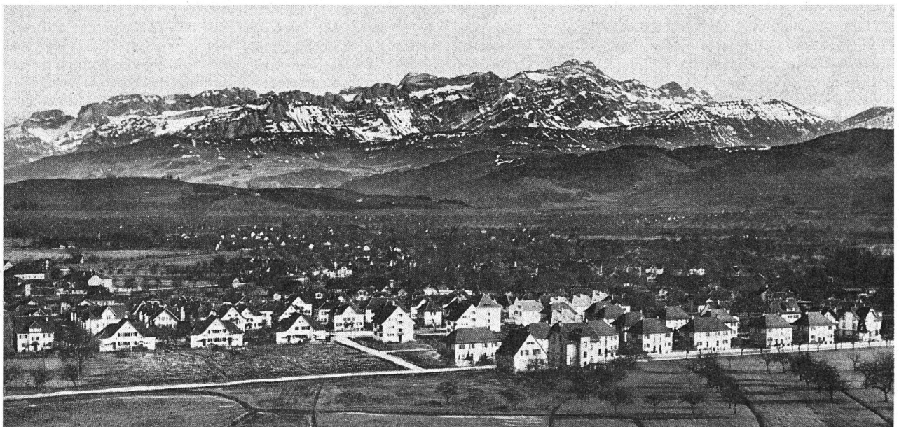
Wohnsiedlung der Baugenossenschaft des Verkehrspersonals Romanshorn mit Blick auf den Alpstein

In Romanshorn fehlen preisgünstige Wohnungen, denn auch der einfache Arbeiter soll die Möglichkeit haben, genügend und sonnigen Wohnraum zu besitzen. Wir stehen darum mitten in den Vorarbeiten für den Bau eines 13geschossigen Hochhauses an bevorzugter Wohnlage und hoffen, damit den hiesigen Wohnungssuchenden vermehrt vorbildliche und gesunde Wohnungen zur Verfügung stellen zu können. P. E.