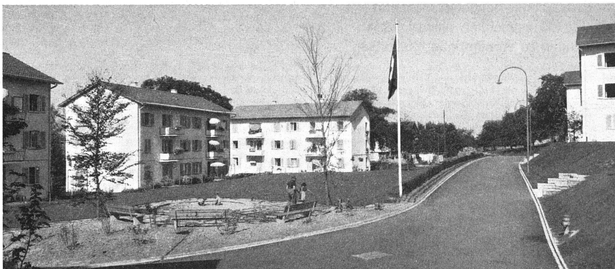
Das Buchareal mit den weiträumigen Spielplätzen der Baugenossenschaft Graphia