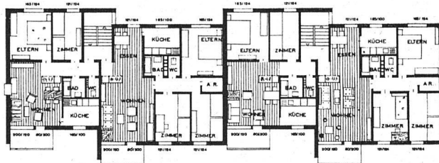
Grundriß Hinterberg, allgemeiner Wohnungsbau