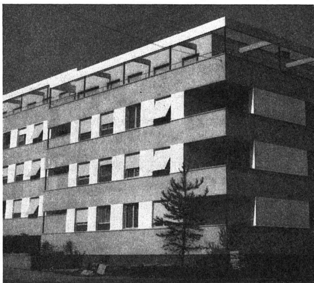
Alterswohnungen der Eisenbahner-Baugenossenschaft Bern

Der Beitrag wurde vorläufig auf 2 Franken pro Monat festgesetzt. Dieser bescheidene Betrag bedeutet kein Opfer, höchstens eine genossenschaftliche Geste. Der Mietzinsausgleich vermag den Genossenschaftsgedanken zu beleben und ist ausbaufähig. Jedem alleinstehenden Mieter in der alten Einfamilienhausssiedlung, der sein Haus für eine Familie mit Kindern freigibt, wird der Mietzins um 10 bis 15 Prozent reduziert. An der Generalversammlung wie im Mitteilungsblatt der Genossenschaft wird mit aller Deutlichkeit darauf hingewiesen, daß es sich bei der Reduktion nicht um ein Almosen, sondern um eine gerechtfertigte Maßnahme handelt. Da es sich bei der gegenwärtigen Wohnungsnot voraussichtlich für Jahrzehnte um einen chronischen Zustand han-