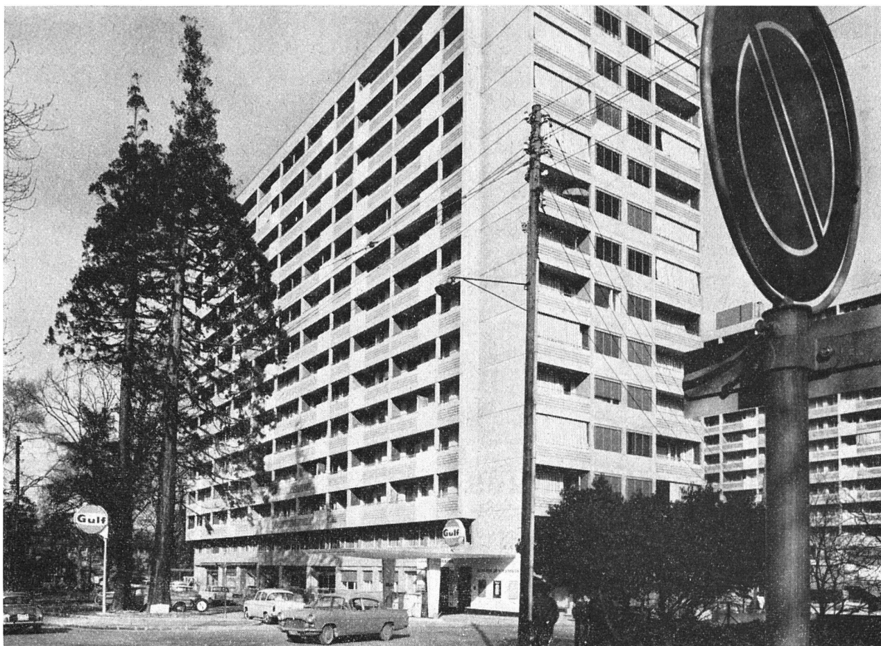
An der Rue Ernest-Pictet in Genf: ein Hochhaus der Eisenbahner-Genossenschaft und der Genossenschaft «Bois-Gentil». Rechts im Hintergrund Gebäude der Cité Vieusseux, von der Société coopérative d'habitation Genève erstellt.

Die Genossenschaft der Eisenbahner kann auf zwei Gebäudeblöcke verweisen, von denen der eine der Vollendung entgegengeht; im ganzen weisen sie 290 Wohnungen auf. Die Eisenbahner haben zudem in der Genossenschaft Bois-Gentil die SBB selbst ihrer tatkräftigen Mitwirkung teilhaftig werden lassen, indem durch diese Genossenschaft für die Bundesangestellten ein Hochhaus mit 146 Wohnungen und 39 möblierten Zimmern erbaut wurde.