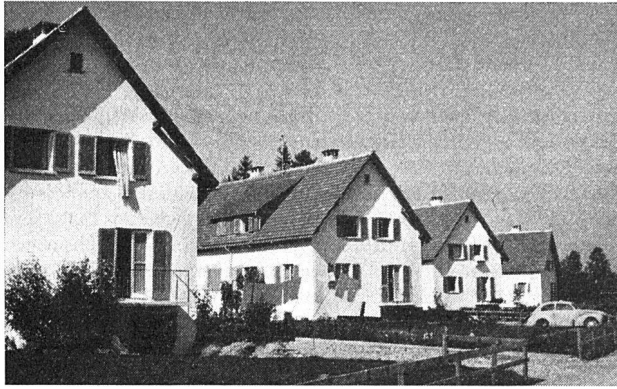
Einfamilienhäuser-Siedlung der Vorarlberger Landesgenossenschaft bei Dornbirn

wurde. Außer nach dem Wohnhaus-Wiederaufbaugesetz, welches im Interesse des Wiederaufbaus von Wohnhäusern, die durch Kriegsereignisse zerstört oder beschädigt worden waren, eine zinsfreie Vollfinanzierung aus Fondsmitteln vorsieht, müssen die Bauwerber sowohl nach den Vorschriften über den Bundes-Wohn- und Siedlungsfonds als auch nach dem Wohnbauförderungsgesetz 1954 und den für die verschiedenen Landes-Wohnbaufonds und dergleichen geltenden Bestimmungen mindestens 10 Prozent der Gesamtbaukosten aus Eigenmitteln aufbringen. Die Restfinanzierung wird aus Hypotheken von Kreditinstituten, zur Hauptsache Spar- und Bau-sparkassen, bestritten.