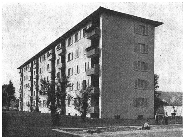
Hörnliststraße 40 bis 44. Bezug der Wohnungen 1. Februar 1960

Das zweite Vierteljahrhundert der Gemeinnützigen Baugenossenschaft Winterthur hat begonnen. Möge auch in diesem Zeitabschnitt der Wunsch nach gemeinsamer genossenschaftlicher Zusammenarbeit erhalten bleiben.