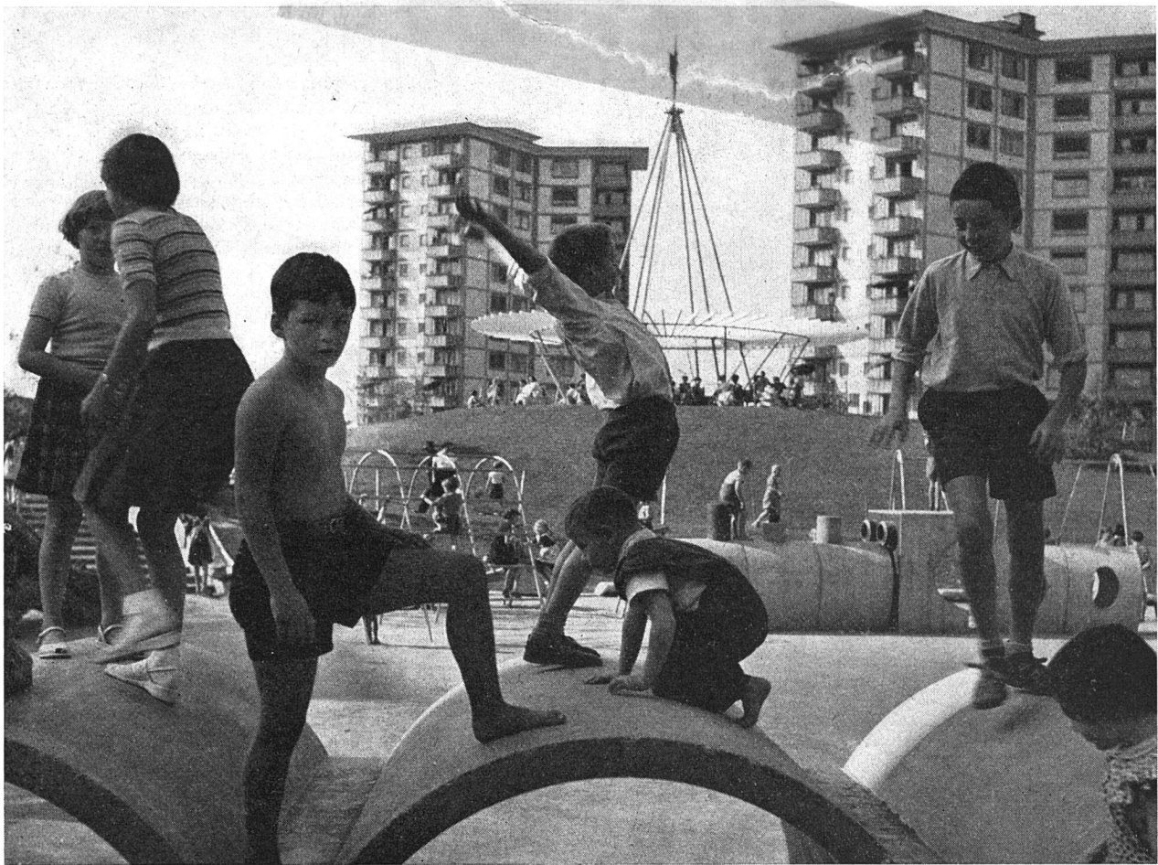
Auf diesem guteingerichteten Kinderspielplatz inmitten einer großen Wohnkolonie Zürichs ist ein wichtiges Problem glänzend gelöst worden. Die Mütter können auf bequemen Bänken des Hügels vom Hintergrund aus ihre Kinder unter Beobachtung halten, ohne daß die spielenden Kinder durch allzu offensichtliche Präsenz von Erwachsenen in ihrem Spielbetrieb gehemmt werden.