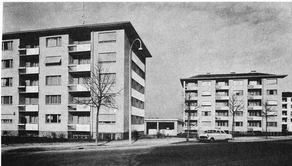
Ansicht der Überbauung