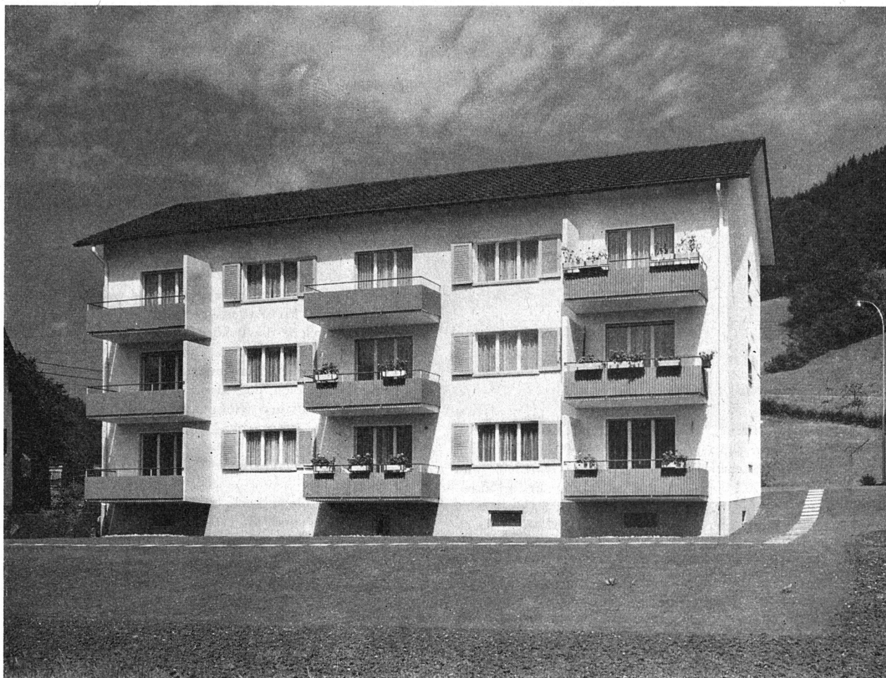
Allg. Baugenossenschaft Kriens — Haus mit 9 Alterswohnungen auf «Feldmühle»