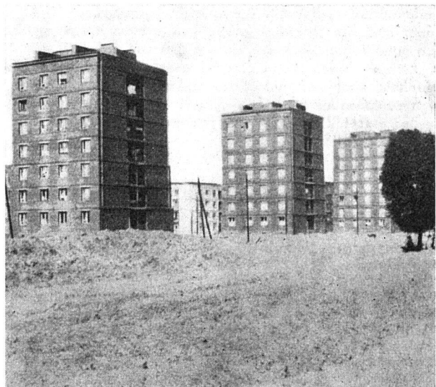
Siedlungsbau in Polen

In den letzten Jahren hat sich in Polen die Ansicht durchgesetzt, Siedlungen als geschlossenes Ganzes für höchstens 8000 bis 10 000 Einwohner zu bauen. In einer solchen Wohneinheit müssen auch alle nötigen Folgeeinrichtungen vorgesehen sein. Weiter muß für genügend Grünfläche gesorgt werden. Innerhalb des Siedlungsbereiches müssen mehrere kleinere Nachbarschaften entstehen, die gemeinsame Grünflächen für 300 bis 700 Einwohner haben. Als unbedingt notwendige Folgeeinrichtungen werden angesehen: Kindergärten, Schulen, Verkaufsläden, Klublokale, Bibliotheken, Postämter, Sparkassen, Apotheken und ärztliche Beratungsstellen. Vor allem waren es zwei Typen von Wohnhäusern, die in diesen Siedlungen erbaut wurden, nämlich mehrsegmentige Wohnhäuser mit höchstens 3 bis 5, selten mit 6 Geschossen, und hohe Punkthäuser. Wo der Staat als Bauherr auftritt, überwiegen die mittelhohen Wohnhäuser. Bei der Konstruktion der Wohnhäuser tritt immer mehr die Großblock- und