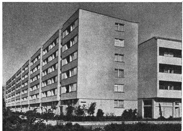
Wohnhausanlage «Schörgenhub», Böhmervaldblock