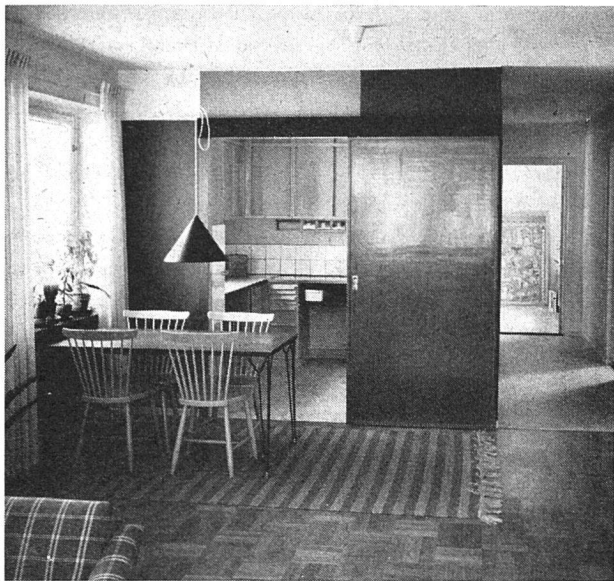
Die Innenarchitektur der Wohnungen huldigt dem Grundsatz: Luft und Licht. Hier gibt es nichts, was bedrückt. Eine Wohnung aus der Hafenstadt Göteborg in Südschweden.

Die Herstellung billiger Häuser und billiger Wohnungen braucht nicht nur Sache des Staates zu sein. Schweden kann hier für alle Länder mit Wohnproblemen wegweisend sein. Die «Hyresgästernas Sparkasse och Byggnadsförening», kurz HSB oder auf deutsch «Sparkassen- und Bauverein der Mieter» genannt, kann mit ihrem Beispiel einen gesunden Weg zeigen.