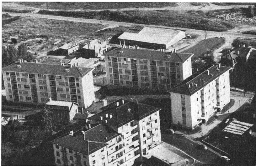
Logement ouvrier – Groupe de Montelly