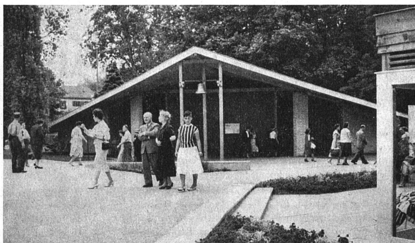
Der Gottesdienstraum an der Saffa steht allen Konfessionen zur Verfügung.

«Wenn Sie Ihrer Frau oder Ihrer Freundin beweisen wollen, welch ein sportlicher, kraftgeladener, geschickter, reaktionsschneller und dabei Ruhe und Sicherheit ausströmender Mann sie an Ihnen hat, so treten Sie an zum Wettkampf um den Dr. Saffa. Jeder Besucher des Männerparadieses darf es einmal versuchen, den vielbegehrten Titel zu erringen. Die Prüfung kostet nichts als ein wenig Courage, und als Expertinnen amten auserwählte Hostessen, die so süß lächeln können, daß auch Durchgefallene auf Wochen hinaus keinen Zucker mehr nötig haben. Wer aber das Examen