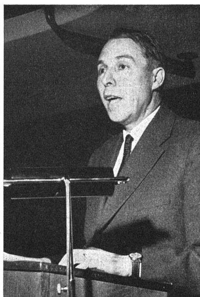
Prof. H. P. Tschudi, Regierungsrat Basel-Stadt