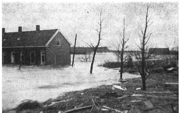
Wassersnot (1. Februar 1953)