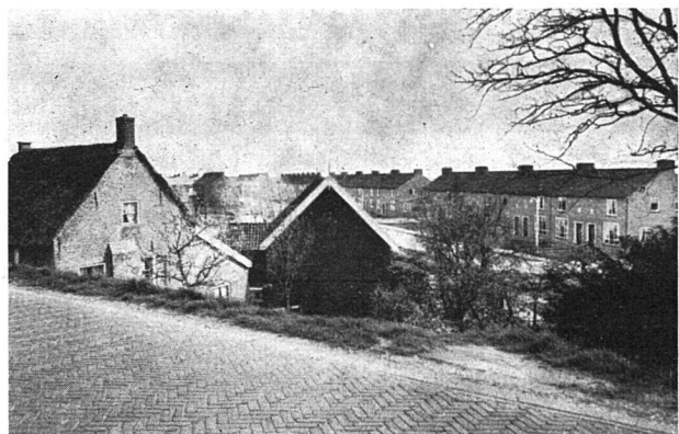
Es sieht aus, als ob sich die alten Häuser hinter den Deich mit der Verkehrsstraße ducken würden, um sich gegen den Wind zu schützen