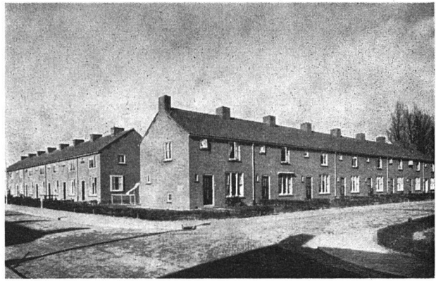
Hoek van de Rovaartstraat, erbaut 1953

Die Genossenschaft, die in Nieuw-Lekkerland eine Siedlung baute, lud uns kürzlich zu einer Besichtigung ein. Ihre Mitglieder arbeiten in den nahe gelegenen Fabriken, in denen Schiffe gebaut werden. Die Siedlung besteht aus zweigeschossigen Reihen-Einfamilienhäusern. Diese sind, dem milderen