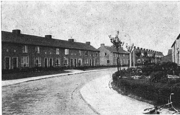
Häuser an der Van Vlietstraat, erbaut 1954

Klima entsprechend, etwas leichter gebaut als bei uns. Sie sehen recht wohnlich aus und sind sauber ausgeführt. Die Gebäudeabstände lassen Raum für schöne Hausgärten und Grünflächen. Spiel- und Sportplätze sind angelegt worden.