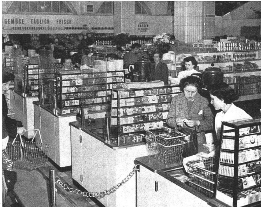
Selbstbedienungsladen St. Annahof (Lebensmittelverein Zürich)

weiterung und Modernisierung der Lager dieses Vereins. Der VSK beliefert nun nicht mehr in unrationellen Kleinstsendungen jeden einzelnen Verein, sondern nur noch das Regionallager. Es können deshalb auf einmal größere Mengen geliefert und ganze Palette gleichartiger Waren verladen werden, so daß die SBB oder die Camions des VSK viel rationeller eingesetzt werden können. Diese Kostenersparnisse erlauben dem VSK selbstverständlich, dem Regionallager bessere Konditionen zu bieten als den einzelnen Vereinen. Diese bedeutenden Einsparungen werden noch fühlbarer, wenn es gelingt, das Sortiment der angeschlossenen Vereine zu vereinheitlichen.