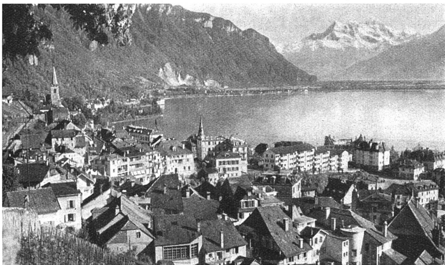
Montreux und die Dents du Midi (im Bilde sind rechts die Genossenschaftsbauten zu sehen)

größeres Grundstück zu verkaufen sei. Die Genossenschaft erwarb es und erstellte darauf – einer glücklichen Idee ihres Präsidenten folgend – eine Siedlung mit 21 Einfamilienhäusern.