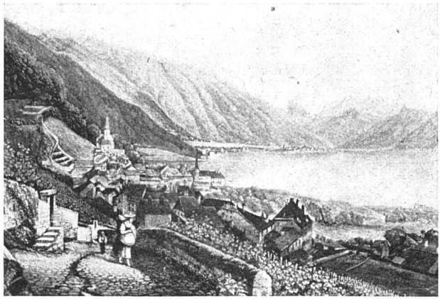
Montreux vor 100 Jahren (nach einem alten Stich)

In Montreux sind dagegen nur aus der Römerzeit zuverlässige Zeugnisse stehender Niederlassungen gefunden worden. So zum Beispiel eine Villa in Baugy , deren wertvolle archäologische Schätze seinerzeit auf wucherische Weise aufgekauft und durch Zwischenhändler im Laufe der zweiten Hälfte des 18. Jahrhunderts in alle Welt zerstreut worden sind. So ist denn fast nichts von alledem in unseren kantonalen und örtlichen Sammlungen verblieben.