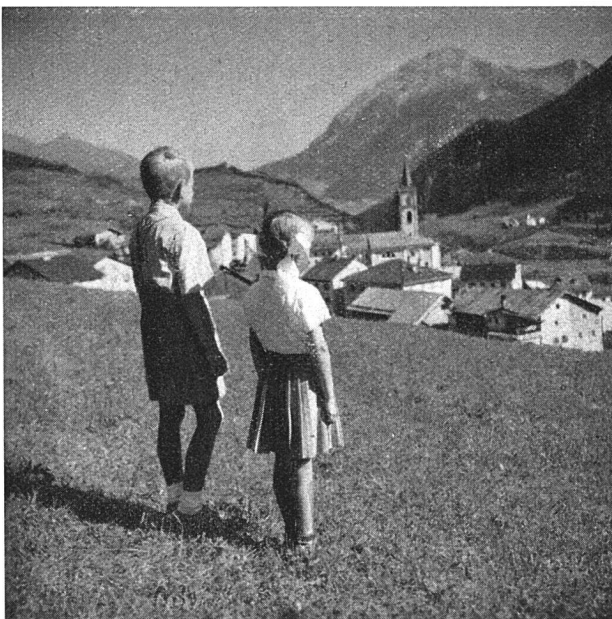
Reams. Blick gegen Lenzerheide