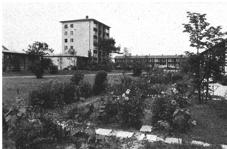
neben neuer gegliederter und gestalteter Siedlungsform

dernen «Shopping Centers» und Vergnügungsparks (Disney Land) oder Forschungszentren zu den ausgeprägtesten Erscheinungen der neuesten Stadtentwicklung, neben Flughäfen und Autostationen, gehören. Wie es da und dort aus früherer Zeit ein «Neues Schloß» oder eine «Neue Brücke» gibt, bestehen Neue Städte (Neustadt, Neuenstadt), die auch schon wieder viele hundert Jahre alt geworden sind. Es gibt biblische Idealstadtpläne (Ezechiel 48); Ausdrücke wie alte und neue babylonische Zustände erwecken automatisch ganz bestimmte Vorstellungen von städtischen Über- und Fehlentwicklungen. Schlagworte des täg-