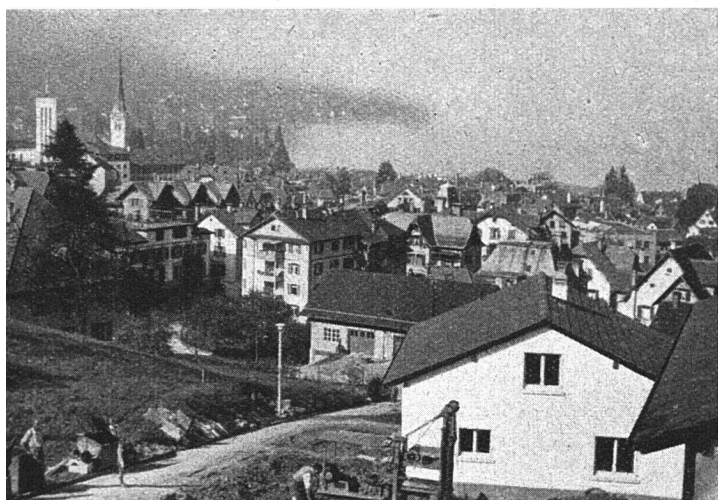
Ältere, breiartig sich ausbreitende Siedlungsform