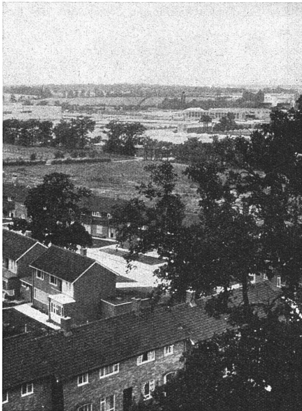
Blick vom «einzigsten Turmhaus» in Crawley New Town

Links: Auf das Industriegebiet mit dem bleibenden Trenngürtel einer Grünanlage