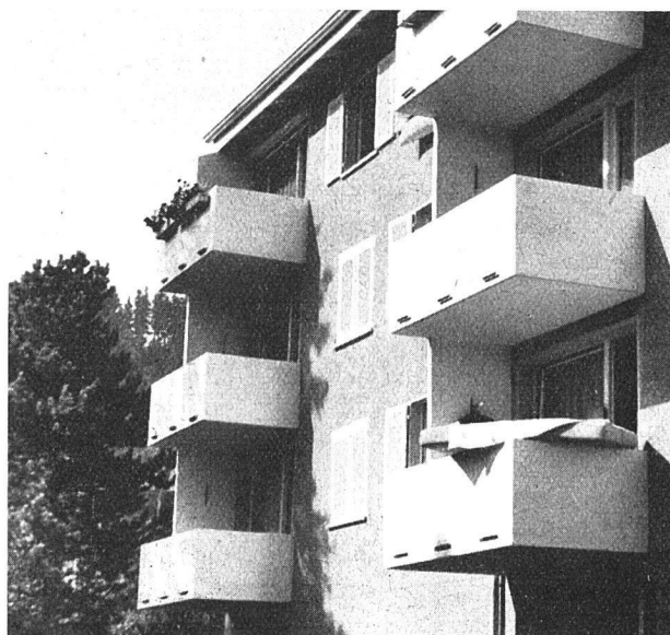
Balkone sind Erweiterungen des Wohnraumes

Die Bautätigkeit ist in St. Gallen rege, doch handelt es sich in den meisten Fällen um Spekulationsbauten. Als Bauherren findet man oft Zürcher Privatleute oder Aktiengesellschaften. Zwar werden durch diesen privaten Bau auch Wohnungen erstellt, sehr oft aber gleichzeitig alte, billige (zum Teil schrecklich verlotterte) Wohnungen abgerissen. Die neuen Wohnungen können von den alten Mietern und von jungen Familien nicht mehr bezahlt werden. Die immer zahlreicher werdenden Inserate in den Zeitungen mit Wohnungsangeboten können deshalb über die drückende Mietzinsnot nicht hinwegtäuschen. Leider ist der genossenschaftliche Wohnungsbau zu wenig entwickelt. Es besteht zurzeit auch kaum Aussicht auf wesentliche Förderung des sozialen Wohnungsbaues durch die Gemeinde, schon gar nicht durch den Kanton, da eine langjährige verfehlte Finanzpolitik ein Ausschöpfen der Steuerkraft bis fast zur Unerträglichkeit nötig macht, und bei Vorhandensein riesiger Bauaufgaben der öffentlichen Hand gleichzeitig eine Steuersenkung verlangt wird. Hingegen wird von der Stadt St. Gallen eine geschickte Bodenpolitik betrieben — was lange vernachlässigt wurde —, und eine fortschrittliche Gesinnung bei der Ausarbeitung von Überbauungsplänen erlaubt auch eine moderne Architektur. Hochhäuser sind im Bau begriffen oder bereits fertig erstellt.