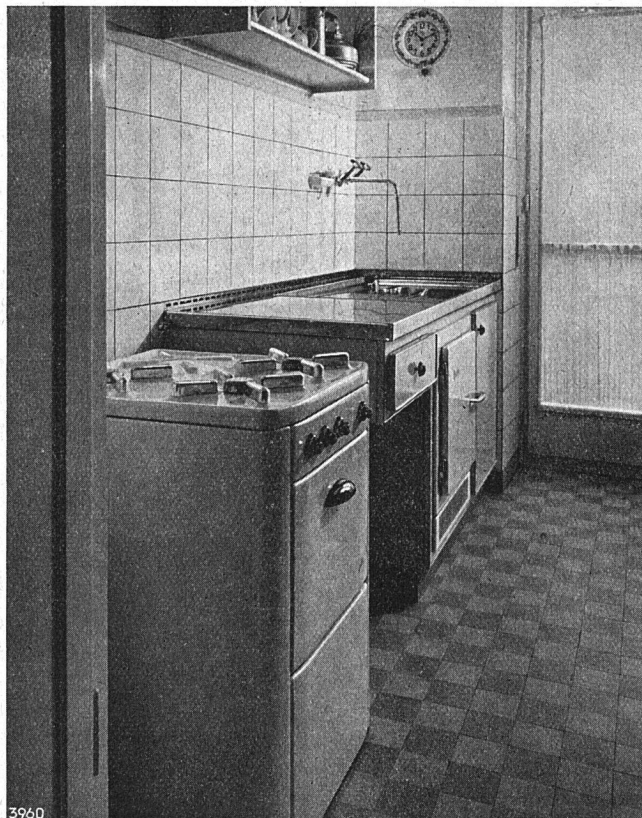
Der moderne Gasherd erleichtert der Hausfrau ihre tägliche Arbeit.

Elcalor-Favorit – so nennt sich eine der erstaunlichsten Neuschöpfungen unter den letzten Elektroherdmodellen. Als bereits bekannte Elcalor-Exklusivität besitzt dieser Herd die stufenlos regulierbare Regla-Blitzkochplatte. Diese ist zudem automatisch gegen Überhitzung geschützt und gestattet merkliche Einsparungen an Kochstrom. Die übrigen, ebenfalls fest eingebauten Kochplatten sind über Neun-Takt-Schalter (das heißt Schalter