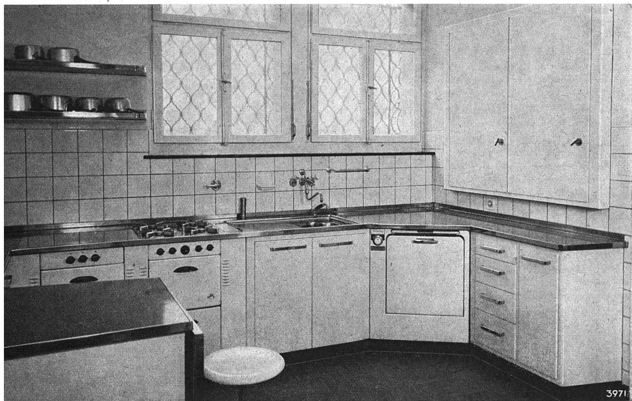
Eine «Wunschküche», mit Gas-Einbauherd ausgestattet.

So ist auch die neueste Errungenschaft der Prometheus AG entstanden: der Herd mit dem schräggestellten Schaltpult und den rot aufleuchtenden Schaltergriffen. Durch die Schrägstellung der Schalteranlage kann die Hausfrau bequemer als bisher die Benützung der einzelnen Platten und des Backofens überwachen. Viele technische Probleme waren zu überwinden, ehe es gelang, in das Schaltgehäuse eine elektrische Lampe einzubauen, die durch ihr Licht den Schaltzustand der einzelnen Heizelemente anzeigt. Bei den neuen Prometheus-Herden genügt ein kurzer Blick in die Küche, um der Hausfrau die Besorgnis vor einer eingeschaltet gelassenen Heizplatte zu nehmen. Jedes eingeschaltete Heizelement wird durch den leuchtenden roten Schalter angezeigt. Daß gleichzeitig ein größerer und bequemer Backofen entwickelt wurde, ist nur eine weitere kleine Neuerung der Herdfabrikation.