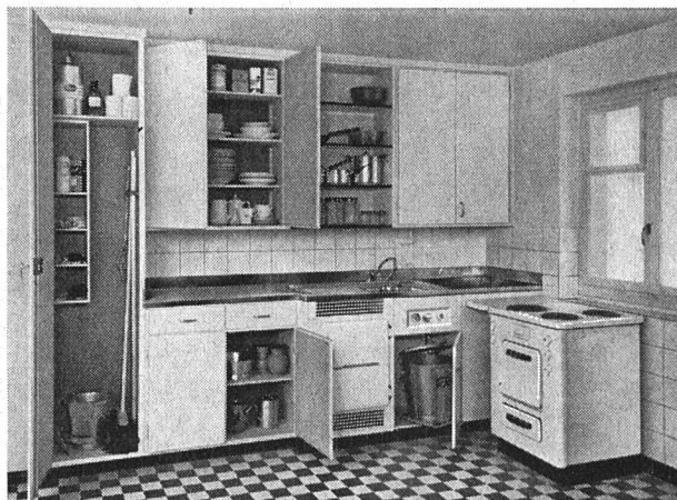
Die neue Göhner-Musterküche. Durch Hinzufügen oder Weglassen einzelner Elemente kann sie beliebig variiert werden.

Im Zeitalter der Farbe wird den Architekten und Bauherren auch bei der Farbgebung der Küche freie Hand gelassen. Den Wünschen der Planer entsprechend, können die einzelnen Teile in verschiedenen Farben gestrichen werden. Die einzelnen Elemente können entsprechend den jeweiligen räumlichen Verhältnissen zu beliebigen Küchenkombinationen zusammengebaut werden. Die abgebildete Musterkombination wie auch die Normelemente wurden in Zusammenarbeit mit der Haushaltungsschule der Sektion Zürich des Schweizeri-