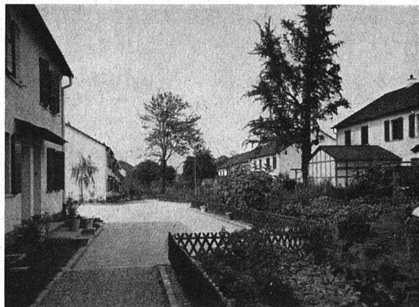
Einfamilienhäuser der Wohngenossenschaft «Zur Eiche» in Basel

Die Aufgaben, welche sich der «Bund der Basler Wohngenossenschaften» bei seiner Gründung gestellt hat, konnten zum größten Teil schon erfüllt werden, an andern wird immer wieder gearbeitet. Neue Probleme werden sich neben den dauernden Aufgaben immer wieder stellen und es ist Pflicht des Vorstandes, diese im Interesse einer gesunden genossenschaftlichen Wohnungspolitik zu lösen.