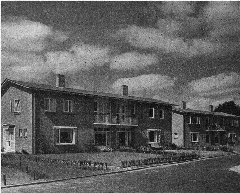
Genossenschaftsbau in Emmen (Provinz Drenthe) Architekt: A. C. Nicolai