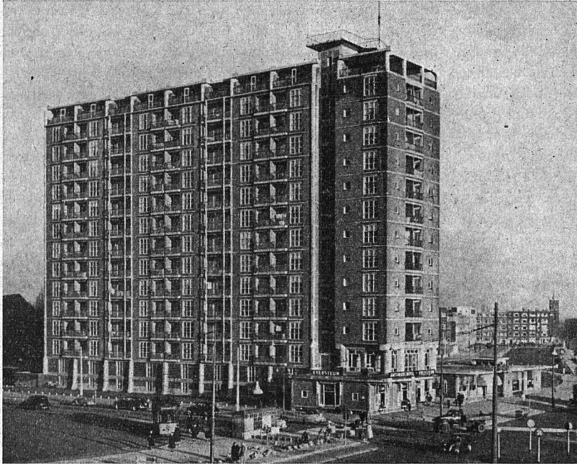
Flatgebäude Zuidplein in Rotterdam Privatbau - Baujahr 1948/1949 Architekten: van Tijen und Maaskant Photo: „Openbare Werken“, Rotterdam - Publikation mit Quellennachweis gestattet