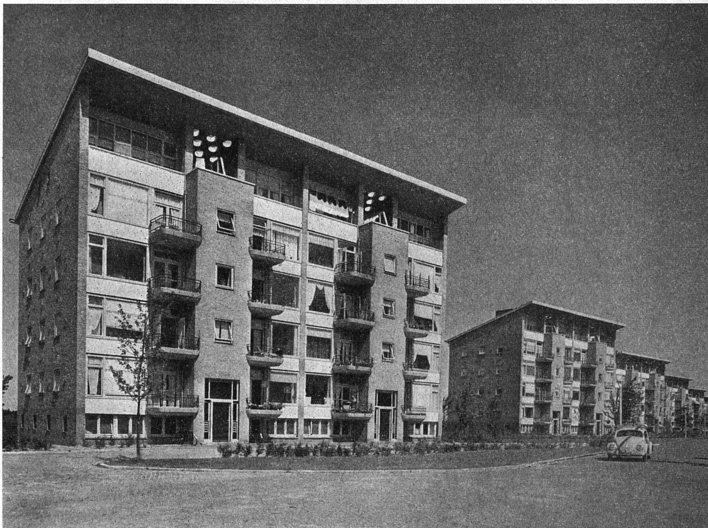
Oben: Soesterviertel, Amersfoort (Utrecht) - Gemeindebau - Baujahr 1952 Architekt: D. Zuiderhoek