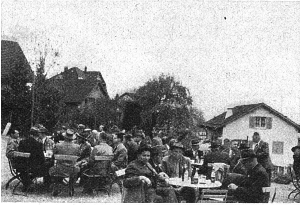
Zwischenverpflegung während der Stadtrundfahrt