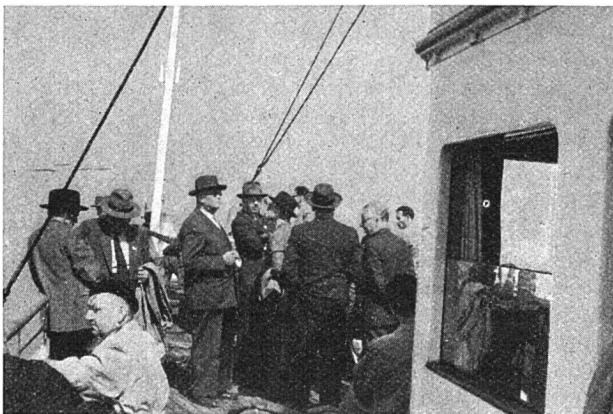
Delegierte der Section Romande

wohnern Darlehen bekommen. Es gibt jedoch noch andere Institutionen, wie Versicherungsgesellschaften, die als Geldgeber auftreten. — Alle diese Hinweise können jedoch nur als Anregungen, nicht als Rezept dienen. Der Verbandssekretär hofft, daß die anschließende Diskussion mithelfen wird, dem genossenschaftlichen Wohnungsbau Mittel und Wege zu zeigen, damit er wieder einen neuen Auftrieb erhält.