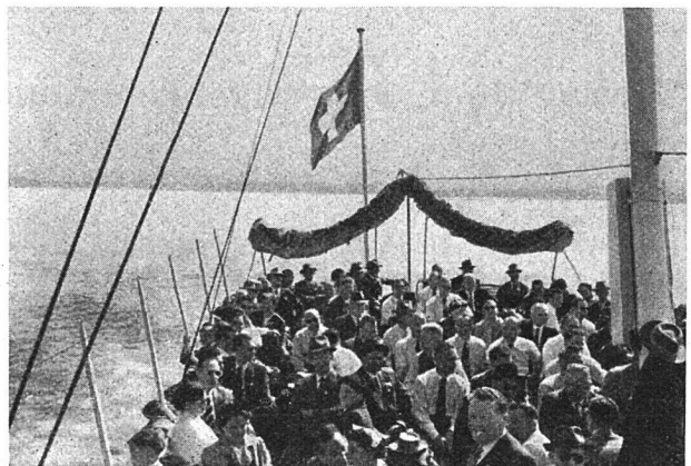
Mit verschränkten Armen sitzt der Präsident der Sektion St. Gallen unter den Delegierten – Er freut sich, daß alles so gut geklappt hat