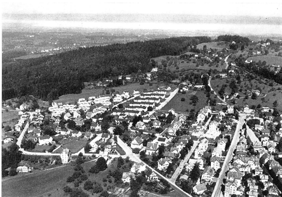
Stadt St. Gallen Rotmonten mit Blick auf den Bodensee

nicht in der Lage, die vermehrte Wohnungsnachfrage auch nur annähernd zu befriedigen. Die katastrophale Lage auf dem Wohnungsmarkt konnte deshalb nur mit öffentlichen Mitteln wirksam bekämpft werden. Diese Einsicht hat das St.-Galler-Volk in wiederholten Abstimmungen eindrücklich bewiesen. In den Jahren 1944 bis 1949 hat die öffentliche Hand (Bund, Kanton und Gemeinde) in der Stadt St. Gallen Barbeträge von rund 12 Millionen Franken erbracht. Davon entfallen auf die Gemeinde St. Gallen rund 5 Millionen Franken. Dank diesen öffentlichen Mitteln sind große Leistungen vollbracht worden, an denen die Wohnbaugenossenschaften bedeutenden Anteil haben. Es darf mit Genugtuung festgestellt werden, daß durch diese Aktionen Wohnungen entstanden sind, die den Erfordernissen der Gesundheit und Hygiene und einer angemessenen Wohnkultur Rechnung tragen. Die Mietpreise des gemeinnützigen Wohnungsbaues sind