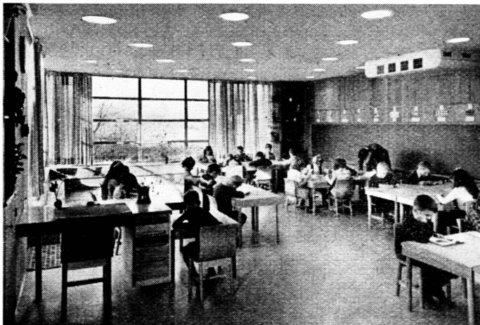
USA baut – Eine moderne Elementarschule