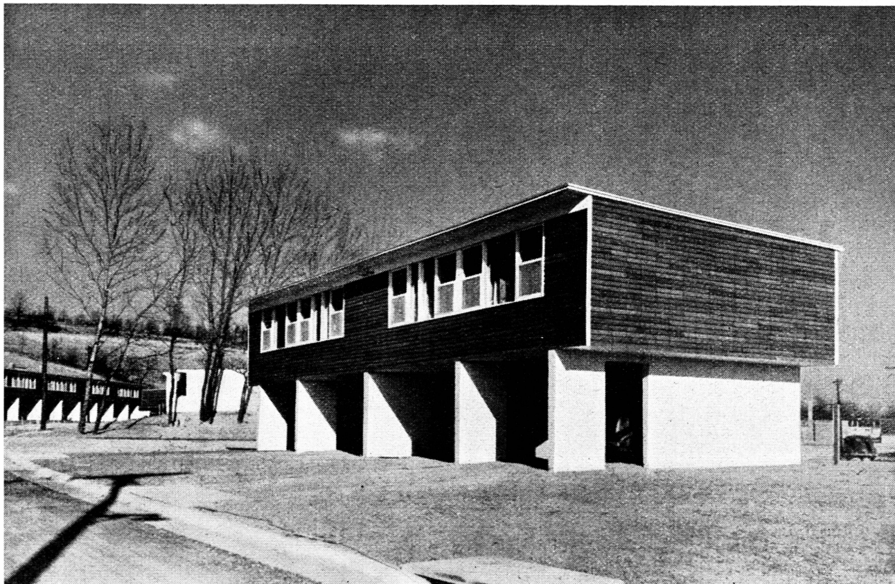
USA baut – Ständerbau mit Einzelwohnungen zu 3 Schlafzimmern

Mitunter harmonieren die neu übertragenen Pflichten nicht ganz mit den ursprünglichen Aufgaben der Organisationen. Einige scheinen auch nicht immer mit rechtem Eifer sich der zugewachsenen Obliegenheiten anzunehmen. Die meisten aber haben durch diesen Zuwachs eine Förderung ihrer Tätigkeit erfahren, die auf weitere Kreise der italienischen Wirtschaft belebend einwirkt. Auch kann nur solche Aufteilung der Funktionen auf eine Vielheit selbst verantwortlicher Träger die nötige Bewegungsfreiheit für ihre individualisierende Erfüllung geben.