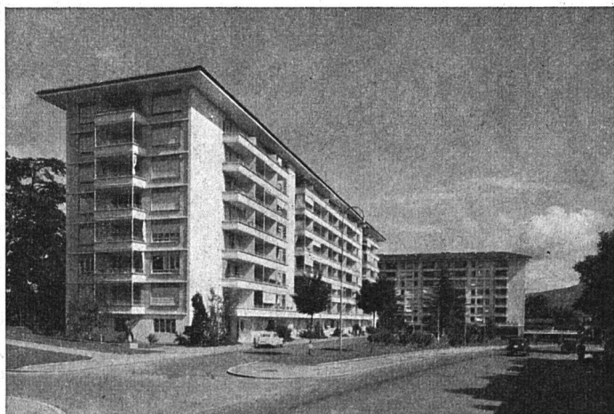
Siedlung Beaulieu, Block «Graphis II», 1950; Fr. Jenny, Architekt, und Gebrüder Honegger, Ingenieure und Architekten; im Hintergrund der Block «Graphis»

Die Vergleichung dieser Zahlen zeigt das enge Verhältnis zwischen der durchschnittlichen Zahl der Personen pro Haushalt und ihrer Zahl pro Wohnung. Wenn eine wesentliche Abweichung festzustellen ist, so handelt es sich um eine Periode der Wohnungsnot. Bei 3. und 4. stellt man fest, daß mit der Zahl von Bewohnern pro Haus Genf und Lausanne an der Spitze stehen. Für diese zwei Städte, wo die Statistik wahrlich