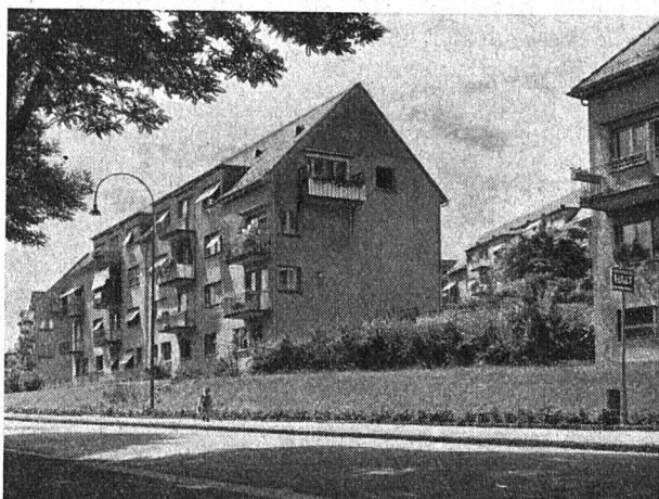
Baugenossenschaft Waidberg Siedlung Tannenrauchstraße. Baujahr 1930/31

Den eigentlichen Höhepunkt der Jubiläumsveranstaltungen bildete die am 8. September im Kongreßhaus durchgeführte Jubiläumsfeier . Die freudig gestimmte Genossenschaftsgemeinde zählte über tausend Personen. Unter den zahlreichen Gästen konnte Präsident Eduard Billeter die beiden verdienstvollen Pioniere und Förderer des genossenschaft-