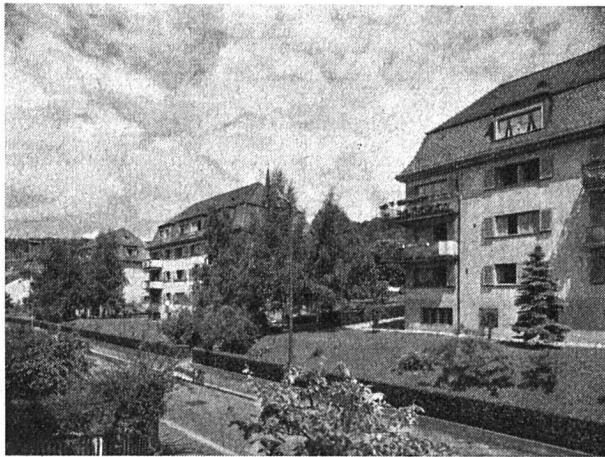
Baugenossenschaft Waidberg Siedlung Geibelstraße. Erbaut 1929/30

wie aus einem besonderen Abschnitt hervorgeht, auch der Frage der Wohngemeinschaft die nötige Aufmerksamkeit widmet. Nebst der Herausgabe dieser sehr bedeutungsvollen Jubiläumsschrift begleitete die «Waidberg» ihr Jubiläumsjahr mit einer nachmittäglichen Schiffahrt auf die idyllisch gelegene Halbinsel Au am Zürichsee und einer großzügigen Jubiläumsfeier im Zürcher Kongreßhaus. Die Jubiläumsschiffahrt auf die Halbinsel Au mit gegen 800 Teilnehmern gestaltete sich unter Mitwirkung eines Handharmonikaspielers und eines Jodelchörlis zu einem prächtig gelungenen Volksfest. Eine besondere Attraktion, sowohl für jung und alt, bildete ein Ballonwettbewerb. Über 300 vom LVZ zur Verfügung gestellte Kinderballons schwebten in etwa tausend Meter Höhe über dem Zürichsee, um schließlich Richtung Ostschweiz abgetrieben zu werden. An die 70 Ballons landeten nach einer Luftreise von mehr als 300 Kilometern in Westdeutschland.