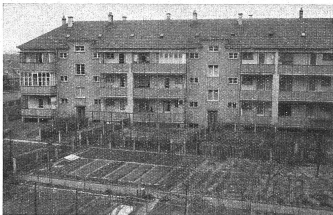
Die Terrassenseite der Häuser an der Hirzbrunnenstraße