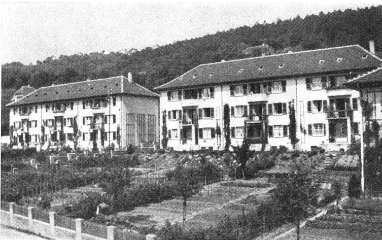
Mehrfamilienhäuser «Sonnhalde» Erstellt 1926/27