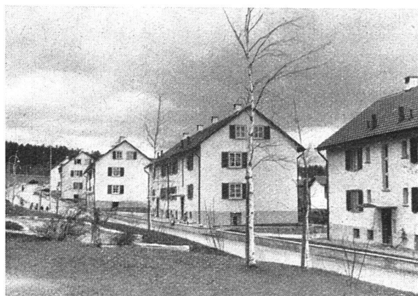
Kolonie VII und IX am Beundenweg

In der großen Wohnbau-Subventionsaktion war die ABW als größte Baugenossenschaft auf dem Platze nicht untätig und eröffnete den Reigen einer größeren