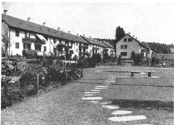
Kolonie VIII von Süden

Die anschließenden Bauetappen VI bis IX, die in den Jahren 1946 bis 1949 hauptsächlich im Gebiete des Beundenweges erstellt wurden, sind Doppelblöcke zu vier Dreizimmerwohnungen mit Küche und Gasbad mit entsprechenden Giebeldachkammern.