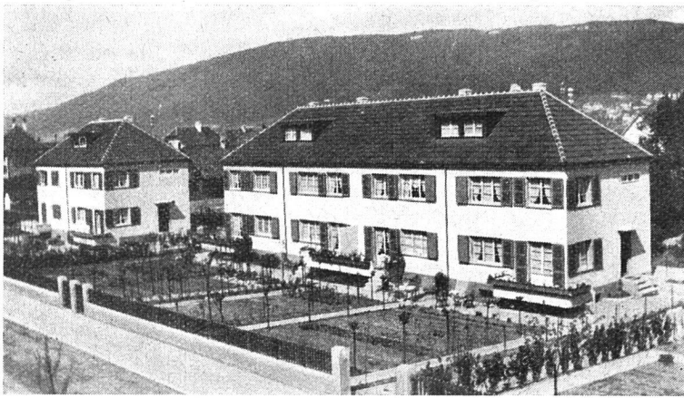
Einfamilienhäuser am Dahlenweg Erstellt 1930