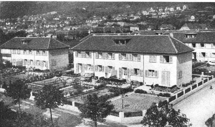
Einfamilienhäuser der Kolonie «Champagne» Erstellt 1929

Genossenschaft und sind unverkäuflich. Jeder Mieter ist zur Übernahme eines Anteilscheins verpflichtet und kann überdies auch Spargelder bei der Genossenschaft deponieren. Nach einer zehnjährigen Mietdauer hat er Anspruch auf eine prozentuale Mietzinsreduktion.