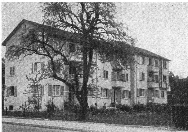
Mehrfamilienhäuser an der Seestraße in Küsnacht

Backstein- und Arbeitermangels und verursachten deshalb außerordentlich viel Mühe und Arbeit.