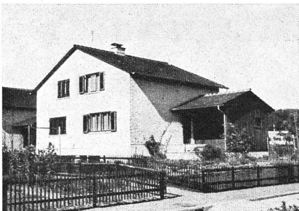
Kolonie von 2 mal 18 Doppel-Einfamilienhäusern in Uster

Trotz all diesen Schwierigkeiten hat sich die «Gewobag» entwickelt und darf heute zu den größeren Genossenschaften im Kanton Zürich gezählt werden.