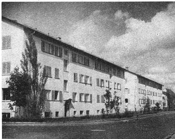
Kolonie an der Ginster-/Süßlern-/Mühlezelgstraße in Zürich-Albisrieden

Alle Wohnzimmer wurden mit dem beliebten Korkparkett und die Schlafzimmer mit Inlaid belegt. Die