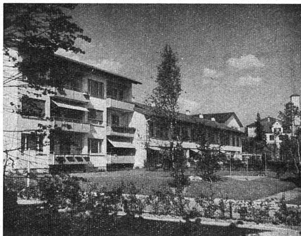
Kolonie an der Birch-/Staudenbühlstraße in Zürich-Seebach

Der Landerwerb zu verhältnismäßig billigen Preisen erfolgte zum großen Teil schon vor Jahren. Die