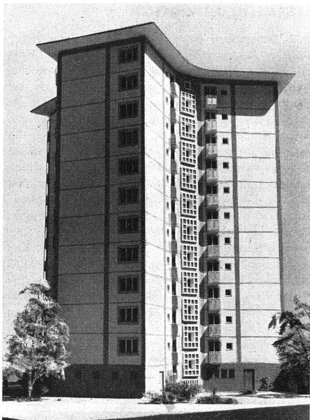
Ost- und Nordfassaden